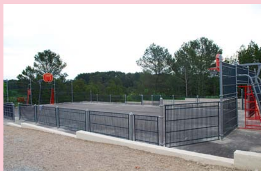
City-stade du Mas d'Armand

Le Conseil communal des enfants est une instance réunissant 5 élèves de Cm1 et 5 élèves de CM2 élus pour un mandat de 2 ans par l'ensemble des élèves de niveau élémentaire. Il permet d'initier les enfants à l'exercice de la démocratie locale et de favoriser leur engagement citoyen. Un animateur accompagne les enfants dans la réalisation de projets d'intérêt général.