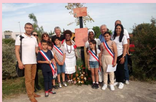
Commémoration de l'abolition de l'esclavage