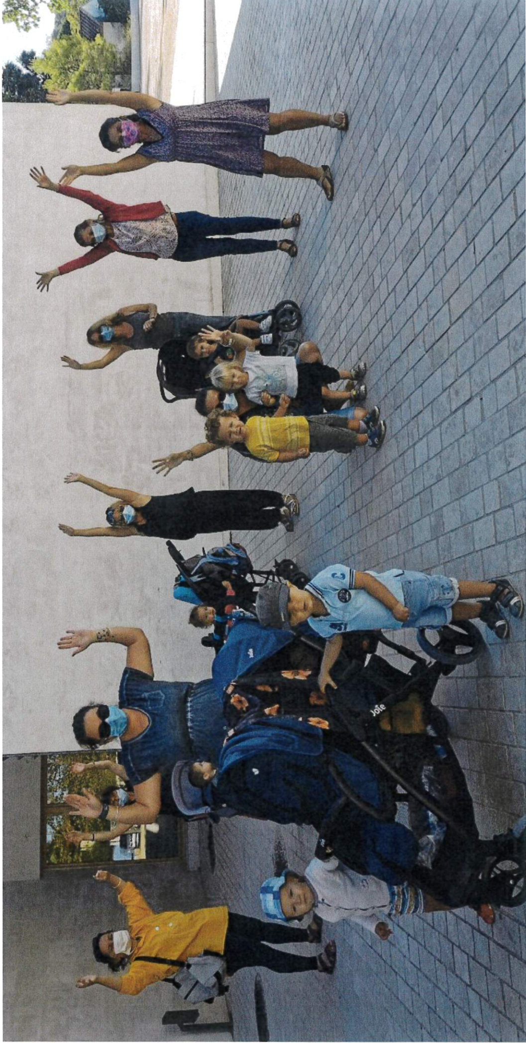
Bébé marcheurs -- Octobre 2020